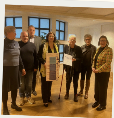
Meepraten over beleid