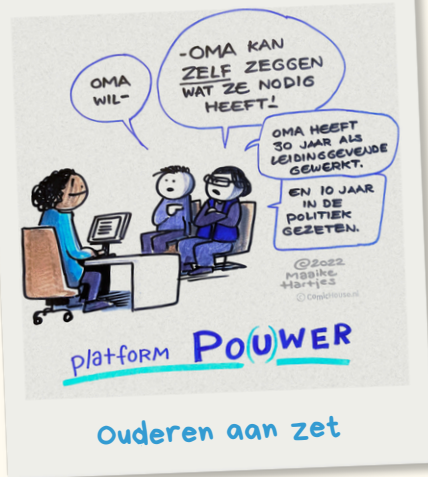
Ouderen aan zet