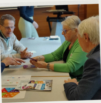
Samen aan de slag